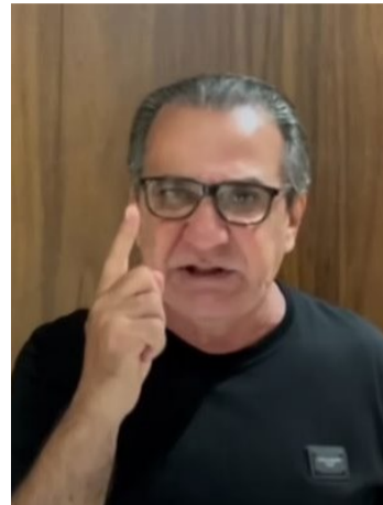
Pastor Silas Malafaia