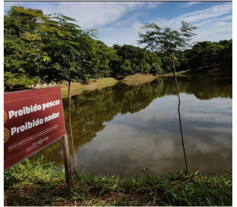
Fiscalização Ambiental autuou suspeito por soltura de peixes no lago do Parque das Flores

Todos os 25 lagos em parques de Goiânia são monitorados pelo órgão ambiental. O manejo das espécies é indicado apenas quando há realmente riscos ao meio ambiente.