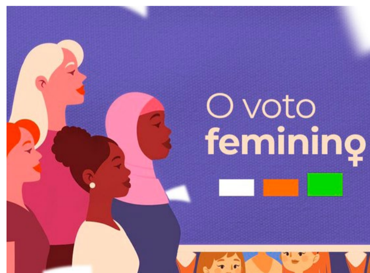
Partidos não mobilizam participação ativa de mulheres/candidatas no país

Nas eleições municipais de 2020, o número de vices cresceu 41% em comparação a 2016, indo de 2.988 para 4.204 candidaturas. O pleito foi o primeiro após a decisão do STF (Supremo Tribunal Federal) e do TSE (Tribunal Superior Eleitoral) que obrigou as legendas a repassar às mulheres tempo de propaganda e verba de campanha proporcional ao número de candidatas —ou seja, ao menos 30%.