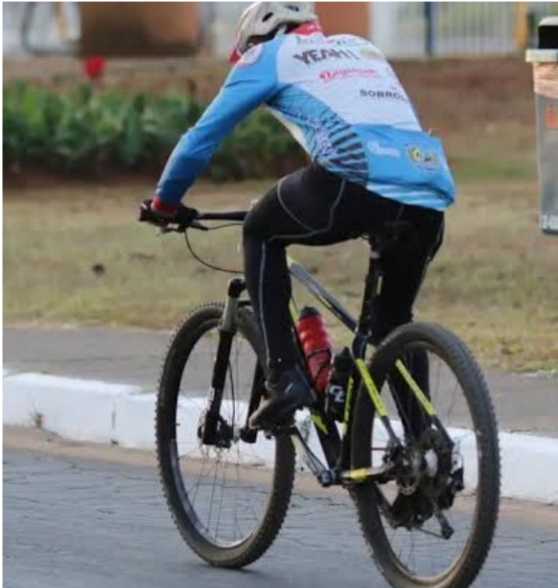
Ciclista querem respeito: metrópoles tornaram-se espaço de prática sustentável de transporte consciente e saudável

Comemora-se nesta segunda-feira, 19, o Dia Nacional do Ciclista. Goiânia é uma das capitais com maior prática do transporte sustentável