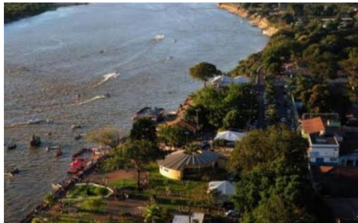
Aruanã está na lista dos municípios que enfrentam onda de calor nos últimos dias

Outra recomendação comum inclui beber água de forma constante. É preciso evitar a prática de exercícios físicos entre 10h e 16 h.