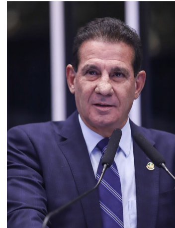
Senador Vanderlan Cardoso