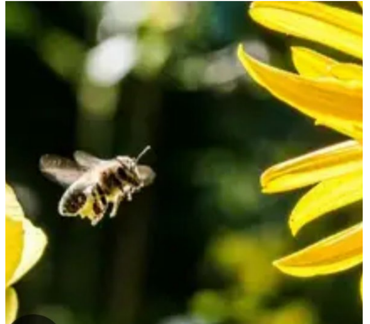
Conforme especialistas, sem abelhas não existe polinização, nem reprodução da flora, sem flora não há animais e sem animais não haverá ser humano

No Brasil, a cadeia produtiva apícola se destaca como uma fonte alternativa sustentável de emprego e renda, especialmente para pequenos produtores: dados do IBGE apontam que 82% dos mais de 100 mil