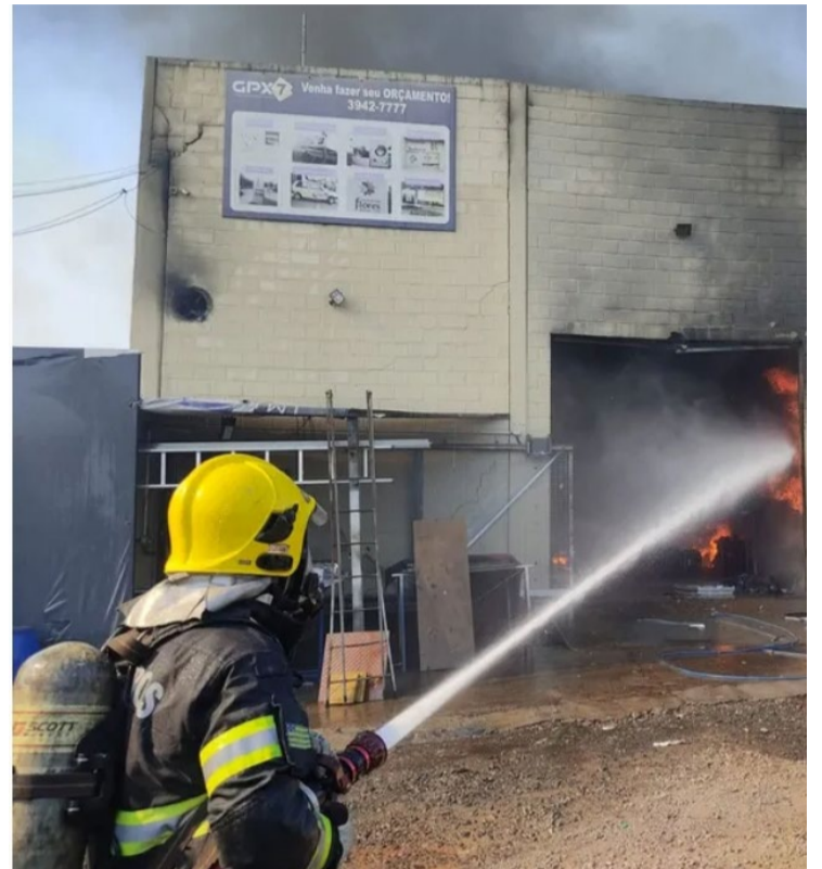
Rescaldo durou 4h e utilizou total de 13 viaturas na mobilização

Evento causou danos à estrutura do prédio e consumiu grande parte do que havia no local. Não houve registro de feridos durante o incidente