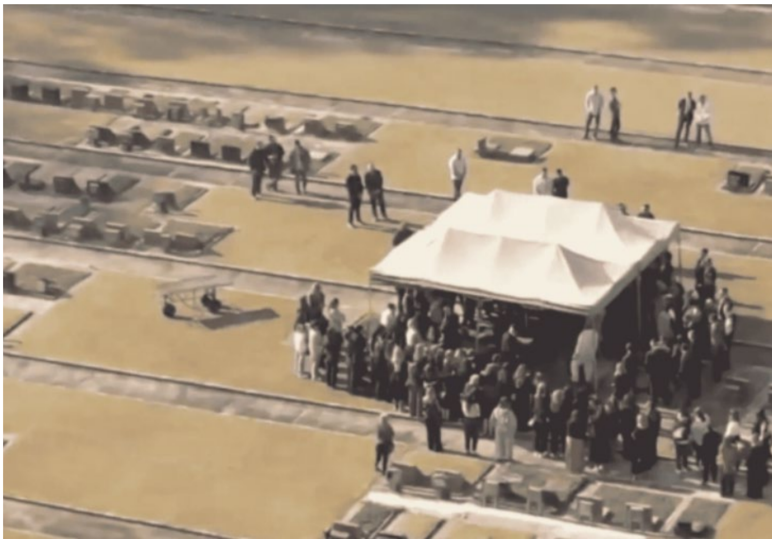
Silvio Santos desejava cerimônia simples para sua despedida: emissoras evitaram helicópteros

Silvio era judeu e seu enterro seguiu o rito judaico, isto é, sem ostentação, enfeites ou flores.