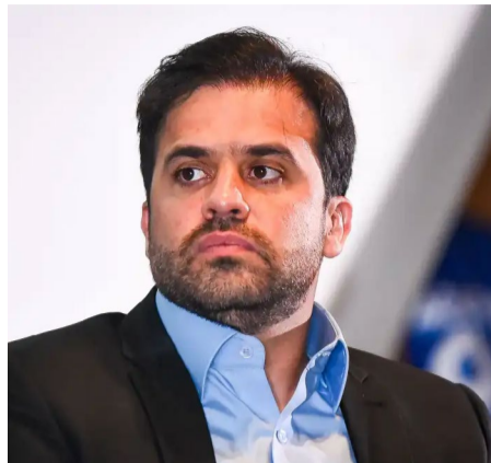
Pablo Marçal (PRTB/São Paulo)